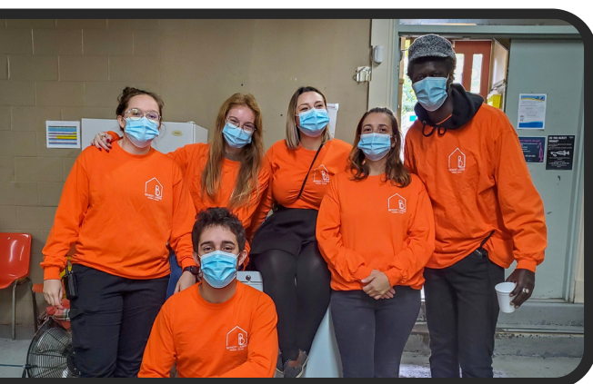
Nos intervenant.es de jour qui soutiennent la journée nationale de la vérité et de la réconciliation, le 30 septembre 2021

Une organisation comme La Maison Benoit Labre, offrant du soutien à la personne, nécessite une variété de services spécialisés.